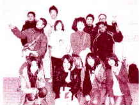
↑ネパールへ出発前に関空にて撮影

光あふれ、花咲き誇る春。如何お過ごしでしょうか？今年の春、私にとってうれしい事がいくつもありました。その中より2つご紹介いたします。