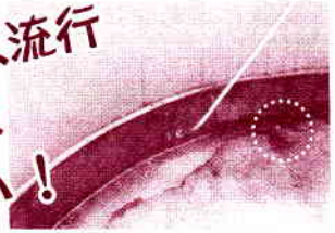
↑タカラダニ駆除作業中

先日、当店管理物件のマンションベランダから体長1mm前後の赤橙色のタカラダニが発見されました。