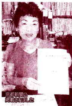
京都新聞に掲載された写真